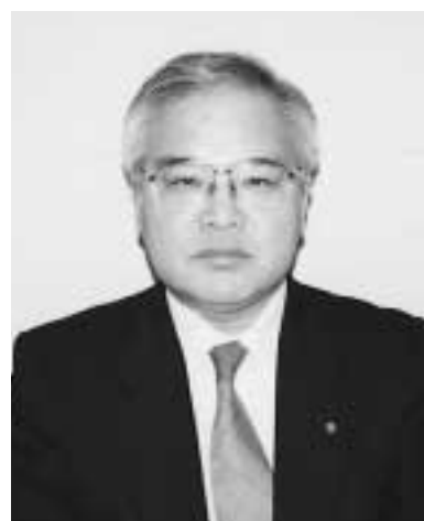
兵庫県産業労働部参事